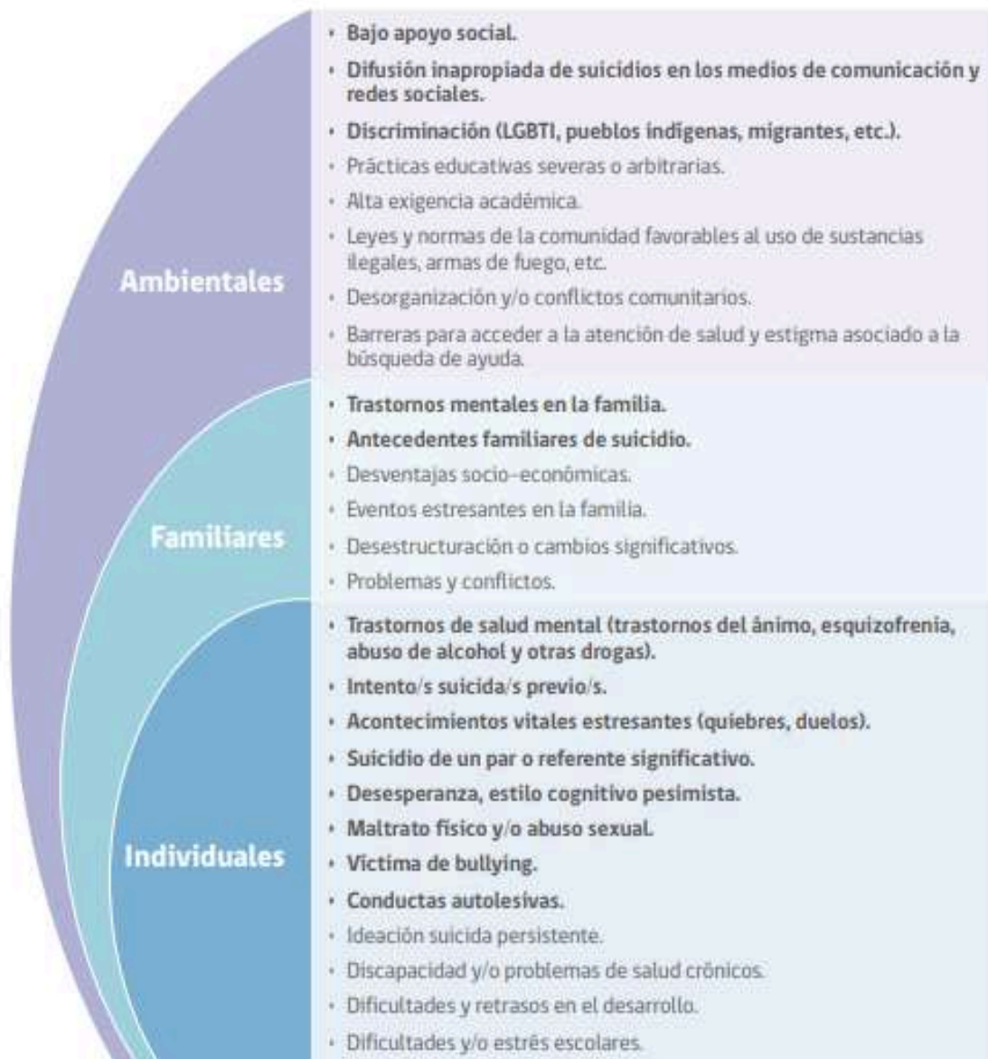
FIGURA 1. FACTORES DE RIESGO CONDUCTA SUICIDA EN LA ETAPA ESCOLAR

Fuente: Elaboración propia en base a Barros et al., 2017; Manitoba's Youth Suicide Prevention Strategy & Team, 2014; Ministerio de Salud, 2012; OMS, 2001; OPS & OMS, 2014.