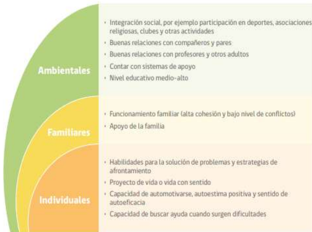
FIGURA 2. FACTORES PROTECTORES CONDUCTA SUICIDA EN LA ETAPA ESCOLAR